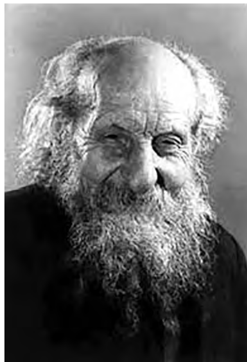
Padre Carlo Crespi

«Non resta che attendere con fiducia il sapiente giudizio della Chiesa», commentano, con soddisfazione e speranza, gli amici di Padre Carlo Crespi dalla onlus che hanno costituito con lo scopo di diffondere su questo territorio la conoscenza della sua figura e delle sue opere. Tra le tante attività di cui l'associazione (di cui fa parte anche un nipote del sacerdote legnanese) si è fatta promotrice, vale la pena di ricordare la mostra che era stata allestita nel 2016 all'interno della chiesetta di Santa Maria della Purificazione, la realizzazione di un volume, le conferenze e i momenti di preghiera, le raccolte fondi per supportare le adozioni di bambini in Ecuador