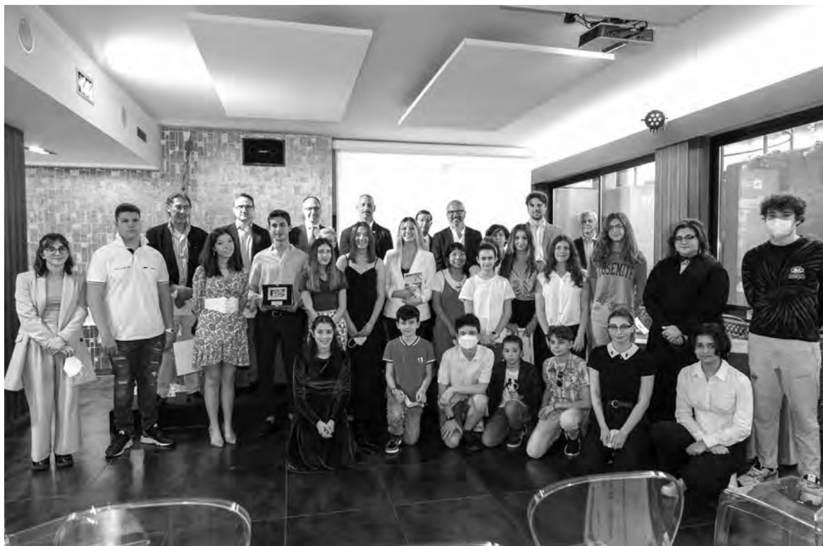
Foto di gruppo con i vincitori

Mariapia Garavaglia presidente della Fondazione Palio