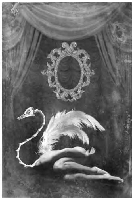
Due immagini fotografiche di Luca Rizzieri