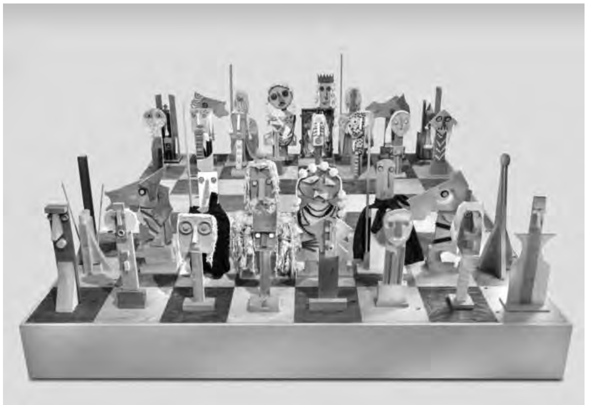
La scacchiera di Enrico Baj